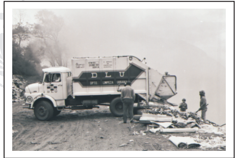
Na década de 80, os caminhões despejavam o lixo direto no meio ambiente