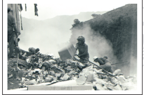
Varadouro São Virgílio, década de 80

Os resíduos iam para um lixão a céu aberto. As pessoas apenas começavam a despertar para a necessidade de proteger o meio ambiente.