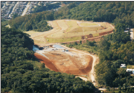
Aterro Sanitário São Giacomo